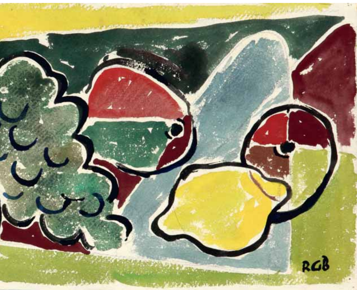
Voće, oko 1940. akvarel, kat. br. 7