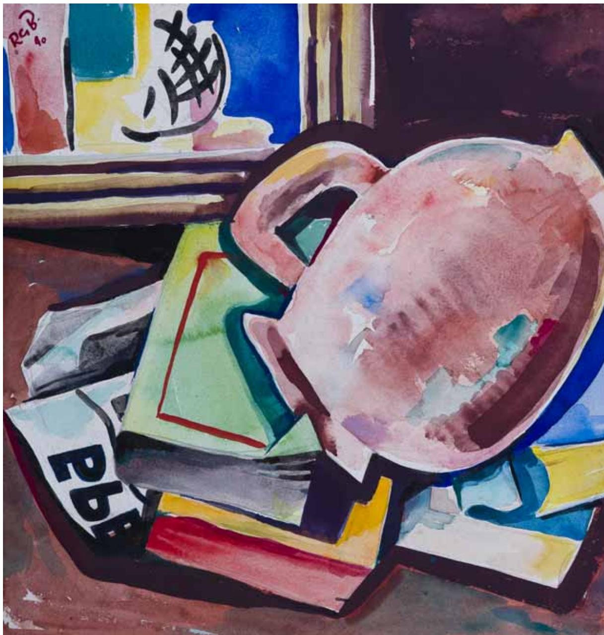
Mrtva priroda s vrčem, 1940. akvarel, kat. br. 5